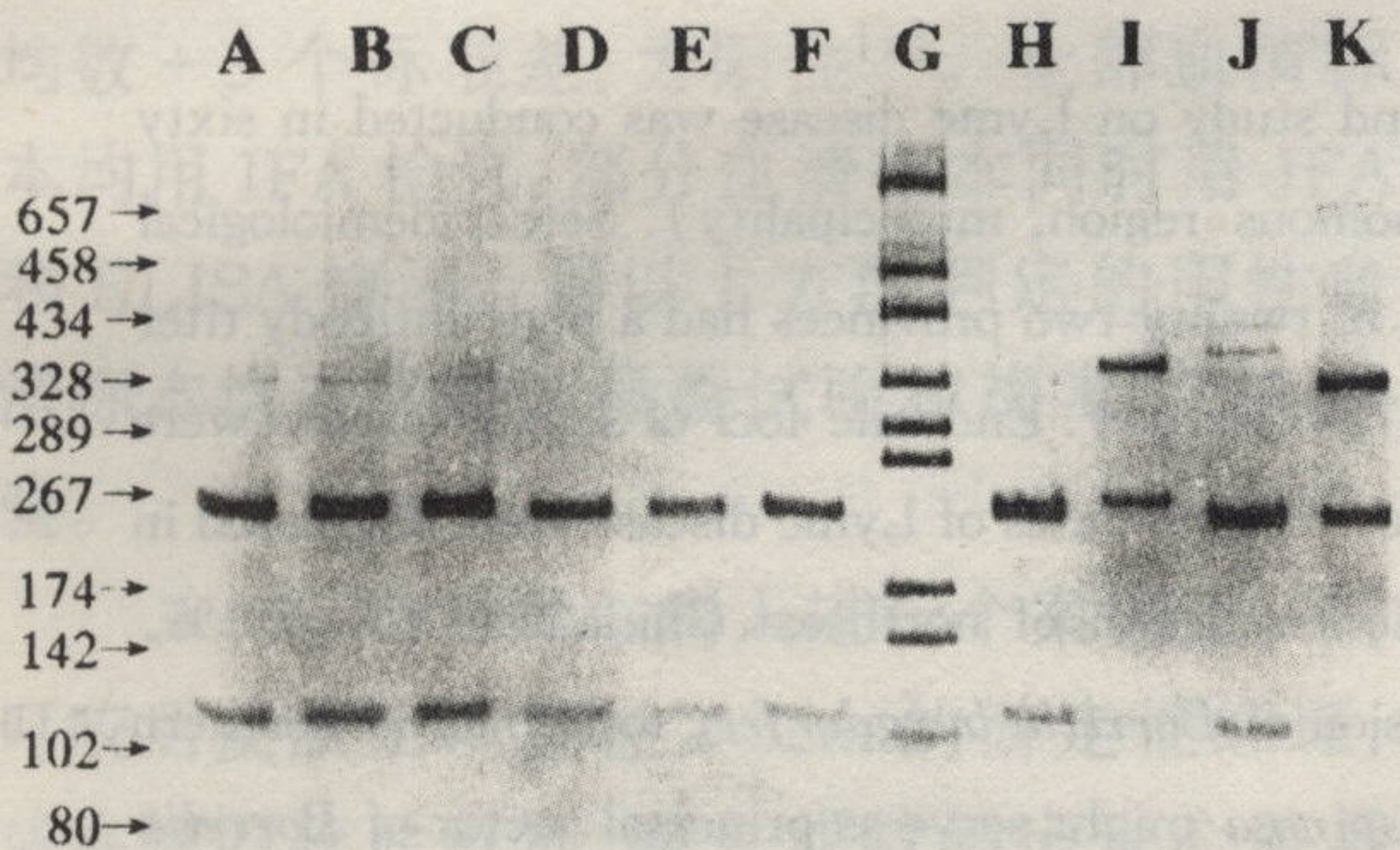
图 2 RsaI 内切酶作用于各检测标本及国际标准株 SFGR PCR/RFLP 银染结果

H R. sibirica 246 株 I R. conorii M7 株 J R. rickettsii R 株 K R. parkerii