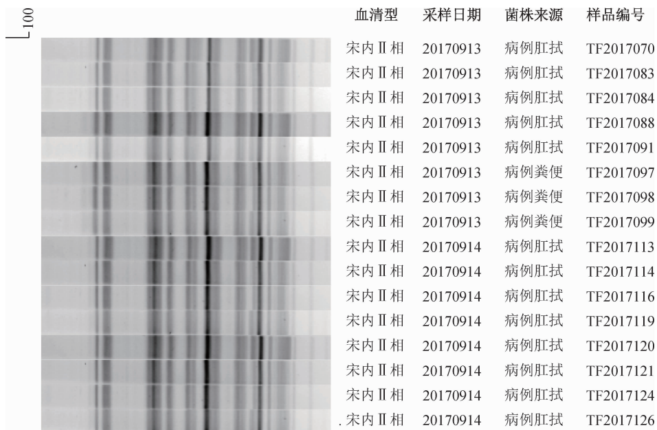
图1 16株宋内志贺菌PFGE分子分型聚类图

志贺菌是引起肠道感染的主要病原,我国以B群福氏志贺菌为主。安徽省淮北市、马鞍山市近年来流行的志贺菌均为福氏志贺菌,宋内志贺菌占比较低。2007—2013年淮北市从监测点腹泻病例中分离志贺菌215株,其中福氏志贺菌占94.42%,宋内志贺菌占5.58% [4] 。2005年马鞍山市分离的67株志贺