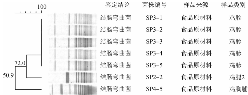
图2 结肠弯曲菌脉冲场凝胶电泳聚类图

1例病例的标本中分离到 C. jejuni 株,其他检测的食源性病原皆为阴性。实验室检测结果表明此次暴发很可能是由于 C. jejuni 感染导致。