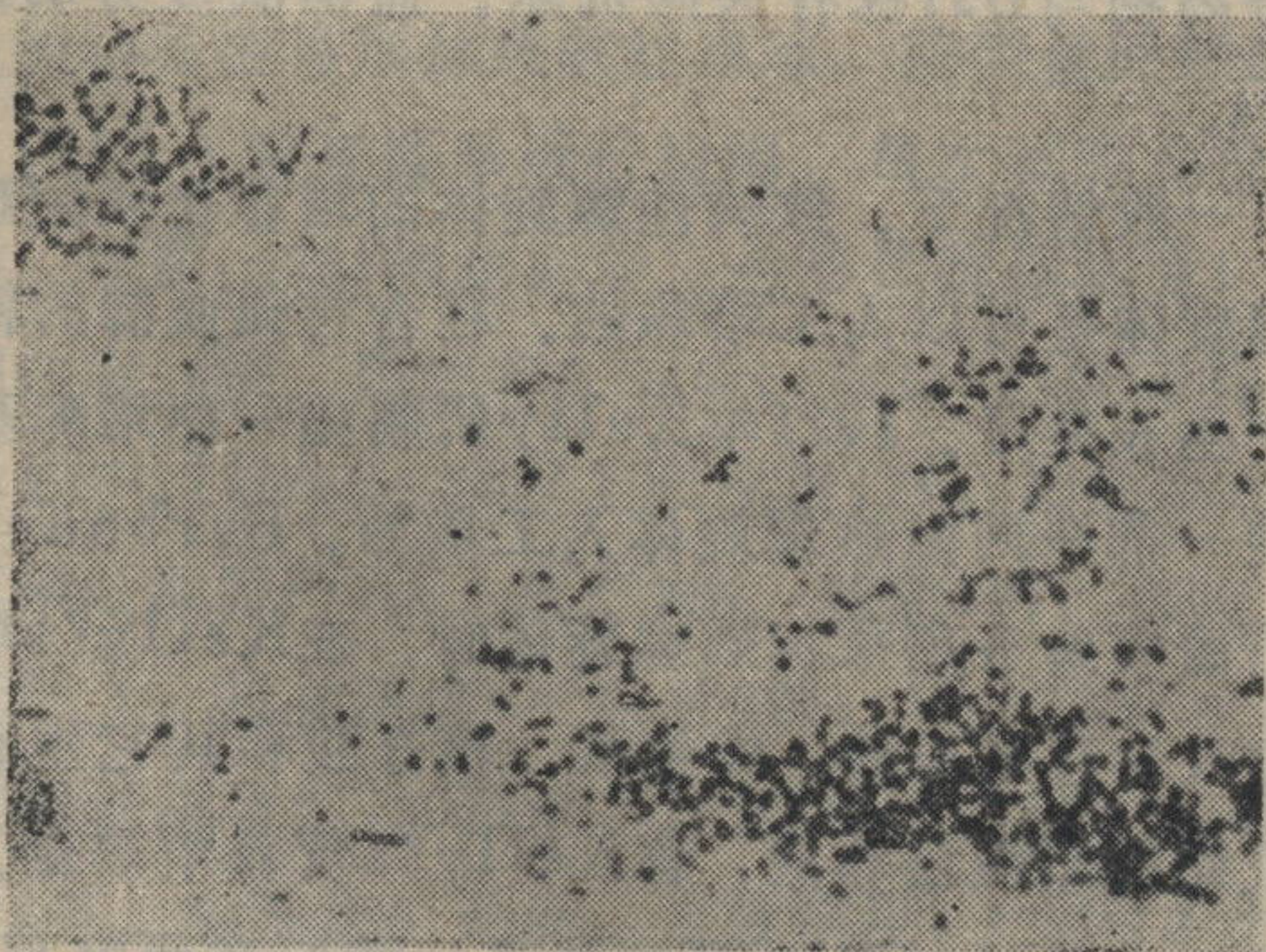
图2 返祖后的正常鼠疫菌 ×1000