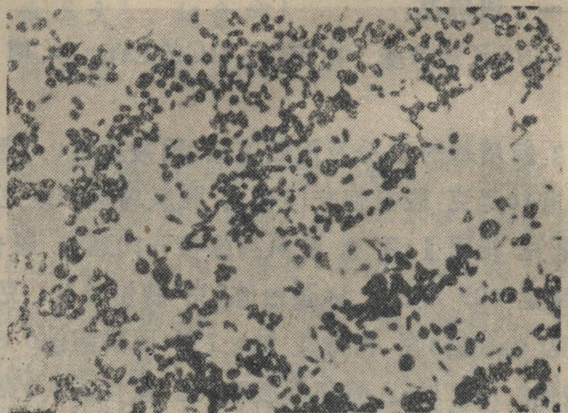
图3 正常鼠疫菌 (7221) ×1000