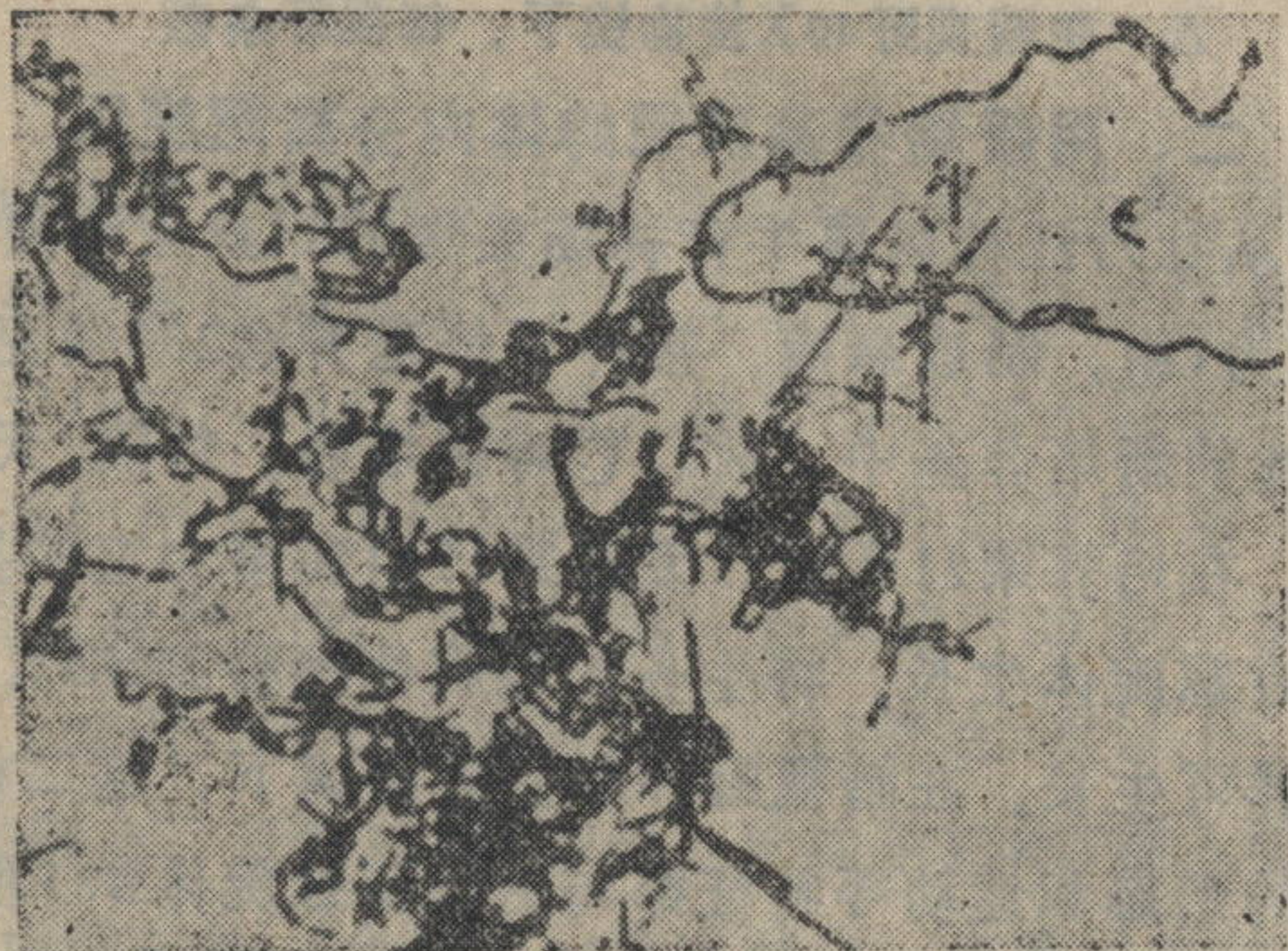
图1 L型样鼠疫菌 (7221) ×1000

试验菌用鼠疫菌7 221强毒株，形态如图3。皮下注射豚鼠体内，接种后48小时杀死，培养心、肝、脾。培养物进行涂片、染色、镜检，发现有L型样菌体如图4。继续观察培养见到逐渐返祖。用鼠疫噬菌体检查返祖后样品，见有噬菌斑出现，证明为鼠疫菌。